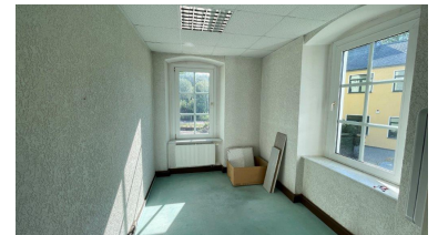
Roßweiner Straße 24 - 04720, Döbeln

GESAMTFLÄCHE: 156,12 m 2 · WOHNFLÄCHE: 156,12 m 2 · ETAGE: 1 · BÜRO: 12